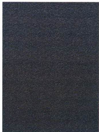
Rockplan, die raue Oberflächenveredelung für Alpinova Re-Stoning Arbeitsplatten von Strasser in Nero oder Verde

ders deshalb, weil außer dem BMK-Vorstand und einer Pressejury auch der Fachhandel sein Votum für die Küchenarmatur Turno Solo abgab. Die Armatur ist im Handel etabliert und wird Küchennutzern als herausragendes Produkt empfohlen. Turno Solo, Design by tbSTUDIO Berlin, setzt auf eine elegante, ästhetische, minimalistische Formensprache und überzeugt mit einem hervorragenden ergonomischen Bedienkomfort. Diesen leistet die Kopfsteuerung am Ende des hohen und schwenkbaren Auslaufs. Bei Betätigung der Armatur fließt das Wasser hinter der Hand, nicht neben dem Unterarm. Für einen weichen und geräuscharmen Wasserstrahl sorgt der Laminarstrahlregler. Turno Solo ist in Edelstahlfinish oder Chrom erhältlich. Das Innovations-Highlight auf der Messe schlechthin ist das neu entwickelte Luftkanalsystem COMPAIR PRIME flow, Gewinner eines German Innovation Award 2023 „Special Mention“ in der Kategorie „Excellence in Business to Consumer – Kitchen“ sowie Preisträger eines „Red Dot 2023“.