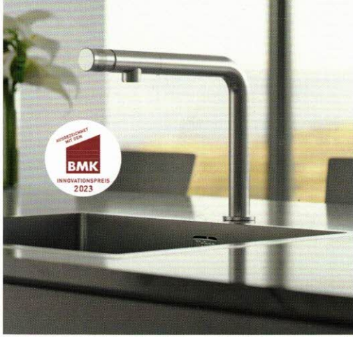
Auf Platz 1: Die prämierte Naber Armatur Turno Solo (Design by tbSTUDIO, Berlin) im Reduce to the Max-Design

hatten sich auf den Weg nach Salzburg gemacht. Geschäftsführer und Inhaber waren mit über einem Drittel unter den Messegästen die am stärksten vertretene Gruppe, 1.370 Gäste kamen aus dem Bereich Vertrieb und Verkauf.