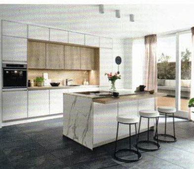
Schon ab KW25 erhältlich sind die neuen nachhaltigen nobilia Senso-Fronten in Premium-Qualität und in Preisgruppe 3