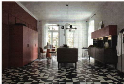
Nolte legt den Fokus auf die Premium-Ausstattungsline nolteneo. Das Foto zeigt Modell neoSLATE mit einer Schieferfront mit dreidimensionaler Oberfläche

VOGT zeigt neben Airforce Dunstabzugslösungen u. a. zwei „Problemlöser“: die hochwertigen Reling-Sets EasyLine von Linero MosaiQ Basic und das Kabelmanagementsystem EVOLine Wing. Mit den ästhetisch-funktionalen EasyLine-Sets Alpha, Bravo oder Charlie für die Nische ist das Wichtigste zum Zubereiten und Kochen stets fix zur Hand und auch gleich wieder aufgeräumt. Die Sets sind Ablage, Aufhängung und Aufbewahrung in einem, in schwarz eloxiertem Aluminium gefertigt mit einem Wandprofil 800 mm. EVOLine Wing ist eine Lösung für in Schubladen integrierte Steckdosen und Charger-Systeme und ermöglicht ein sicheres Kabelmanagement für alle beweglichen und/oder ausziehbaren Möbelteile – ob waagrecht oder senkrecht, passend für Schubladen ab 400 mm Breite und bis 590 mm Auszugslänge und für alle Kabelarten (z. B. HDMI, LAN) – ohne diese zu knicken oder einzuklemmen, da der Wing die Leitungen z. B. platzsparend hinter dem Schubfach führt. EVOLine Wing ist für Metall- und Holzschubladen geeignet und kann zudem in der Kombination mit dem Steckdosenelement EVOLine R-Dock USB bestellt werden.