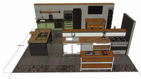
Premiere für Noodles Authentic Furniture & Authentic Kitchen – das Label arbeitet u. a. mit Smeg, Spekva und Bora zusammen – und die neue Kücheninsel mit einem Kochfeldabzug Bora Professional 3.0

Der absolute (Messe-)Star bei Naber ist das innovative Luftkanalsystem COMPAIR PRIME flow. Es steht für eine maximal effiziente Lüftungstechnik (ausführlich in KH 6-2022). Wie dies geht, wird anhand eines eigens dafür konzipierten Do-it-yourself-Bereichs gezeigt, in dem die Fachbesucher das neue Luftkanalsystem mit seiner einfachen Verlegetechnik testweise montieren können. Zu weiteren Messe-Highlights zählen Cox Base Q und Cox Stand-UP aus dem SELECTakit Abfallsammler-Sortiment. Cox Base Q ist eine Kombination aus Abfallsammler und Wasserspeicher für 600 mm breite Möbelkorpusse. Das Behälter-System mit Softeinzug und Dämpfung integriert einen stabilen Rahmen für den Quooker Cube Kaltwasser- und den Pro3 Kochendwasser-Speicher. Cox Stand-UP wurde für vorhandene Auszüge mit unterschiedlich hohen Fronten entwickelt. Es umfasst drei Behälterhöhen für verschiedene Korpusbreiten/-tiefen und berücksichtigt zudem die verschiedenen Zargenhöhen der Möbelhersteller. Neben Exponaten aus dem TABLON-Interieurprogramm gibt es flexible und nachhaltige Einbauspülen-Konzepte zu sehen sowie das Naber TRIO: Spüle, Armatur und Abfallsammler, die für perfekte Workflows und Stauraumlösungen optimal aufeinander abgestimmt sind.