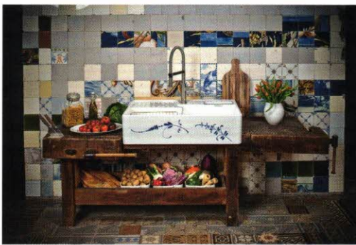
Villeroy & Boch zeigt anlässlich des 275. Firmenjubiläums seinen beliebten keramischen Spülstein mit dem neu interpretierten Dekor Brindille

burg werden die Fronten in den Ausführungen Grifflos, mit Holz und auch schwarzen Akzenten gezeigt sowie Planungen mit 845-mm-Korpushöhe und Küchen mit Durchgangstüren. Ganz neu: baumannLIVING. Damit wird der Fachhandel inspiriert, wie sich mit dem Möbelsortiment weitere Wohn-, Arbeits- und Funktionsbereiche kreativ gestalten lassen – auf Wunsch auch mit Komplettanleitungen. Zudem gibt es mehrere prämierte Designideen in Salzburg zu sehen, z. B. TreeTime (sechs furnierte Fronten in sechs Farbstellungen) sowie Beschläge und Auszüge von Blum und Arbeitsplatten von Strasser.