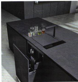
Salzburg-Premiere für die Weltneuheit Solitaire – The Waterbase

Hinzu kommen etliche Premieren wie z. B. von Leicht Küchen, Noodles, Gaggenau und Solitaire – The Waterbase, MCR, Dometic, Axora möbel austria, Cold Spring Home – Exklusivpartner der Irinox Home Collection, die Holzschmiede Massivholzmöbel, Palette CAD, Rauchenzauner Möbel und Wolfgang Spitzer Raumdesign und Raumakustik.