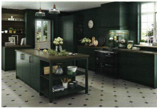
Aus der Bauformat Kitchen Collection: Modell Porto – jetzt komplett maßvariabel – wird grifflos und mit schwarzen Akzenten vorgestellt