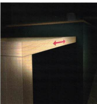
Flex Dining Table von Beckermann ist ein maßvariabler kleiner Esstisch, dessen Tischfläche sich ganz einfach ausweiten lässt

seine Dekor- und Keramikkompetenz. Darüber hinaus werden neue kompakte Keramikspülen gezeigt, die auch in kleine Küchen Design und Komfort bringen: Bei der Subway Style 45 bietet das geräumige Becken mit Abtropffläche viel Platz – bei dem Einzelbecken Subway Style 50 S erzeugt eine schmale Stufe in der Keramik zusammen mit Zubehör eine zusätzliche Funktionsebene. Abgerundet wird das Ganze mit Armaturen aus massivem Edelstahl im neuen, tiefschwarzen Finish Matt Black.