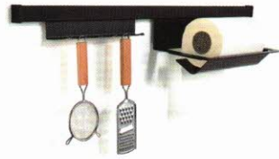
U. a. bei Vogt zu sehen: Die Reling-Sets EasyLine (Foto: Set Charlie) von Linero MosaiQ Basic und die sichere Kabelführung EVOLine Wing für alle beweglichen und/oder ausziehbaren Möbelteile

Das Fachmesse-Doppel ist täglich von 9.00 bis 18.00 Uhr geöffnet. Eintritt und Catering sind kostenfrei – das Eintrittsticket kann online gebucht werden. Die Parkplätze befinden sich in ausreichender Menge direkt gegenüber dem Messezentrum. Wer es nicht persönlich nach Salzburg schafft, kann online mit dabei sein, denn es gibt täglich rund um die Uhr online Livestreams, Live-Chats und Live-Video-Calls bis einschließlich 5. Mai 2023. (gr) ■