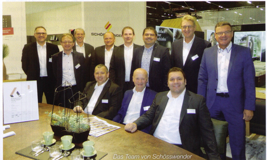
Das Team von Schösswender

www.moebel-austria.at www.kuechenwohntrends.at