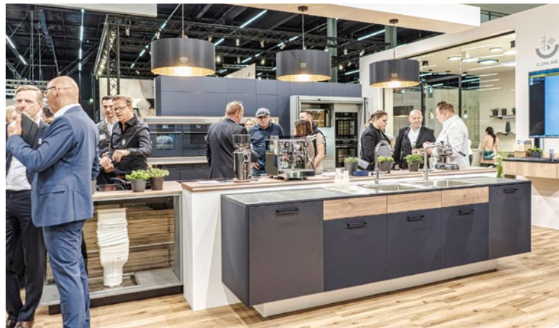
Die Küchenwohntrends und Möbel Austria 2023 zog über 5.800 Fachbesucher aus Österreich, Deutschland, Italien und 18 weiteren Nationen an.