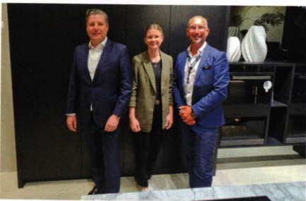
Das Team von Häcker Küchen