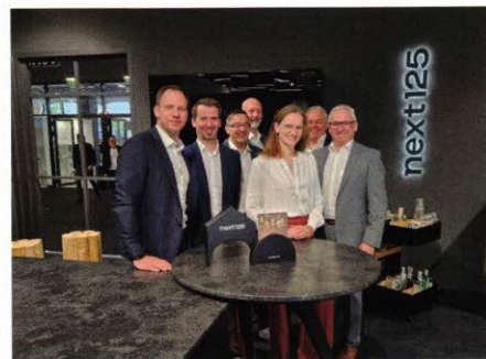
Das Schüller-Team zufrieden mit der Messe

Die beliebten Podium Events waren auch 2025 stark nachgefragt. Renommierete Experten präsentierten praxisnahe Einblicke und diskutierten aktuelle Branchentrends. Zu den Zahlen: Besucher: Möbelhandel (28 %), Tischler und Schreiner (25 %), Vertreter von Küchenstudios (20 %),