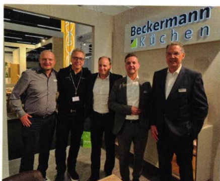
Gemeinschaftsstand von: Ritter-Werke, Hans Grohe, SMEG, Beckermann Küchen