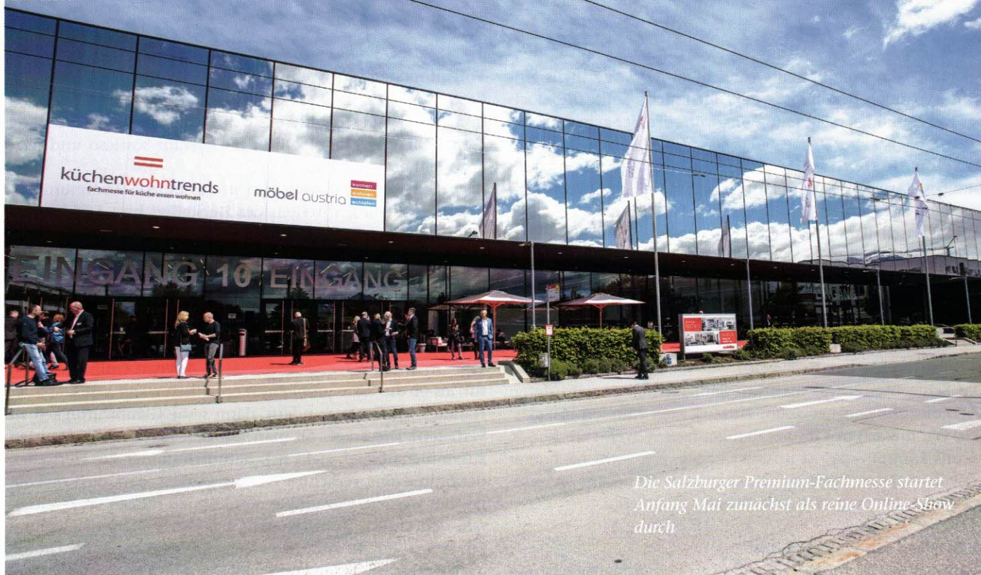
Die Salzburger Premium-Fachmesse startet Anfang Mai zunächst als reine Online-Show durch